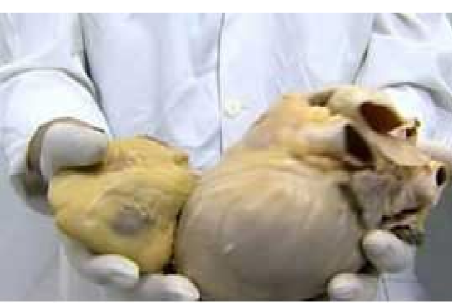
Нормальное и "пивное" сердце.